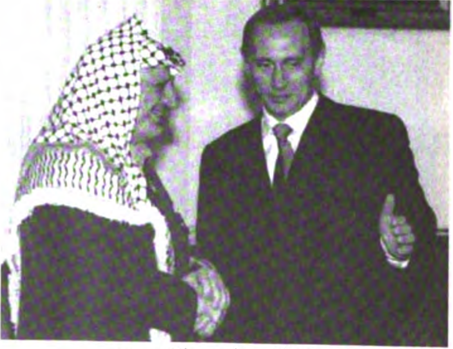
مع الرئيس الروسي فلاديمير بوتين